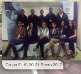
Grupo F: 19-20-21 Enero 2017