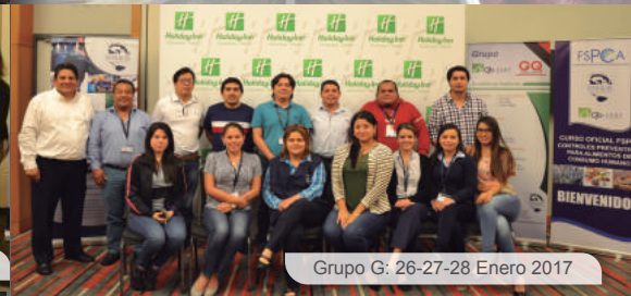
Grupo G: 26-27-28 Enero 2017

La nueva regulación de la US FDA, la CFR 117 - Buenas Prácticas de Manufactura y Análisis de Peligros y Controles Preventivos basados en el Riesgo para Alimentos de Consumo Humano (HARPC), buscan asegurar la inocuidad de los productos alimenticios que se consumen en los Estados Unidos. Esta regulación, que entrará en vigencia el 17 de septiembre de este año, exige que algunas actividades que realizan las empresas que elaboran/procesan, empaican o almacenan alimentos, sean ejecutadas o supervisadas por un "individuo calificado en controles preventivos" (PCQI).