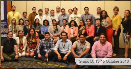
Grupo D: 13-15 Octubre 2016