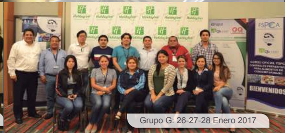
Grupo G: 26-27-28 Enero 2017

La nueva regulación de la US FDA, la CFR 117 - Buenas Prácticas de Manufactura y Análisis de Peligros y Controles Preventivos basados en el Riesgo para Alimentos de Consumo Humano (HARPC), buscan asegurar la inocuidad de los productos alimenticios que se consumen en los Estados Unidos. Esta regulación, que entrará en vigencia el 17 de septiembre de este año, exige que algunas actividades que realizan las empresas que elaboran/procesan, empaican o almacenan alimentos, sean ejecutadas o supervisadas por un "individuo calificado en controles preventivos" (PCQI).