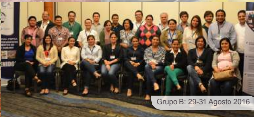
Grupo B: 29-31 Agosto 2016