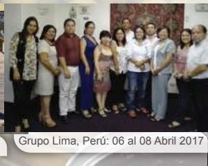
Grupo Lima, Perú: 06 al 08 Abril 2017