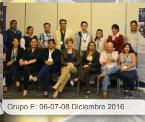
Grupo E: 06-07-08 Diciembre 2016